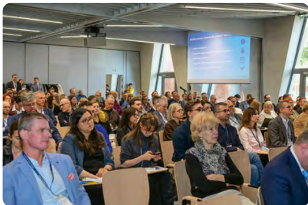
Frekwencja na Zjeździe dopisała