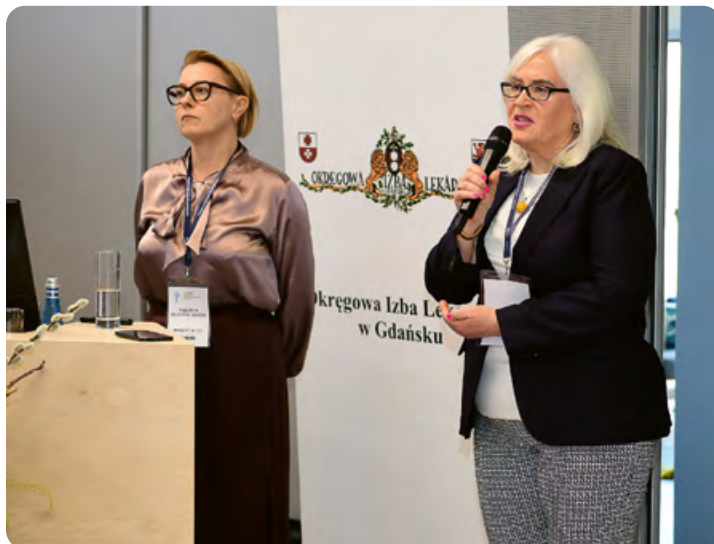
Kandydatki na Rzecznika Odpowiedzialności Zawodowej odpowiadają na pytania z sali

Ubiegłoroczny zjazd upoważnił Okręgową Radę Lekarską do przekazania środków finansowych na zakończenie budowy, wskazując jednocześnie maksymalny poziom nakładów na tę inwestycję. Dziś ten etap jest już częścią historii, a nowy ośrodek może wreszcie pełnić funkcję, dla której został powołany.