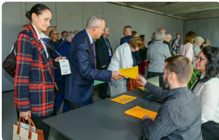
Wydawanie kart do głosowania