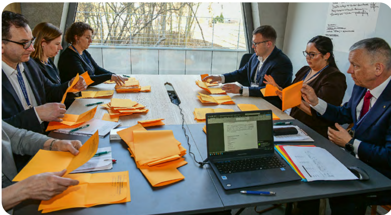
Liczenie głosów – Komisja Skrutacyjna podczas pracy