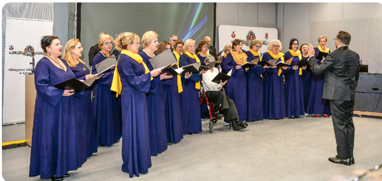
Nasz niezawodny chór uświetnił krótkim koncertem obrady Zjazdu