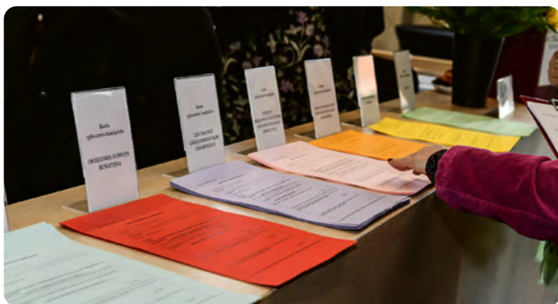
Karty do zgłaszania kandydów, pełna demokracja...