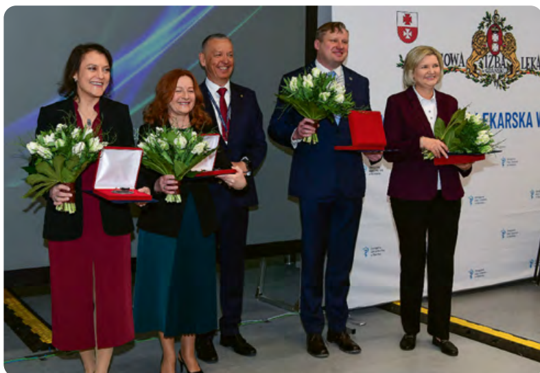
Laureaci nagrody Pro Bono Societatis Medicorum Pomeraniae