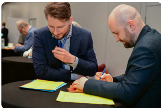
Na kogo by tu zagłosować...