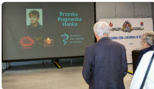
Uczczenie pamięci zmarłych członków Izby, wyczytywanych kolejno po nazwisku