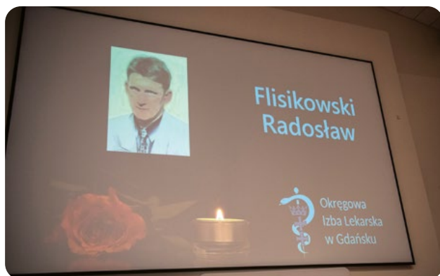
Każdy zmarły członek Izby został odczytany z imienia i nazwiska