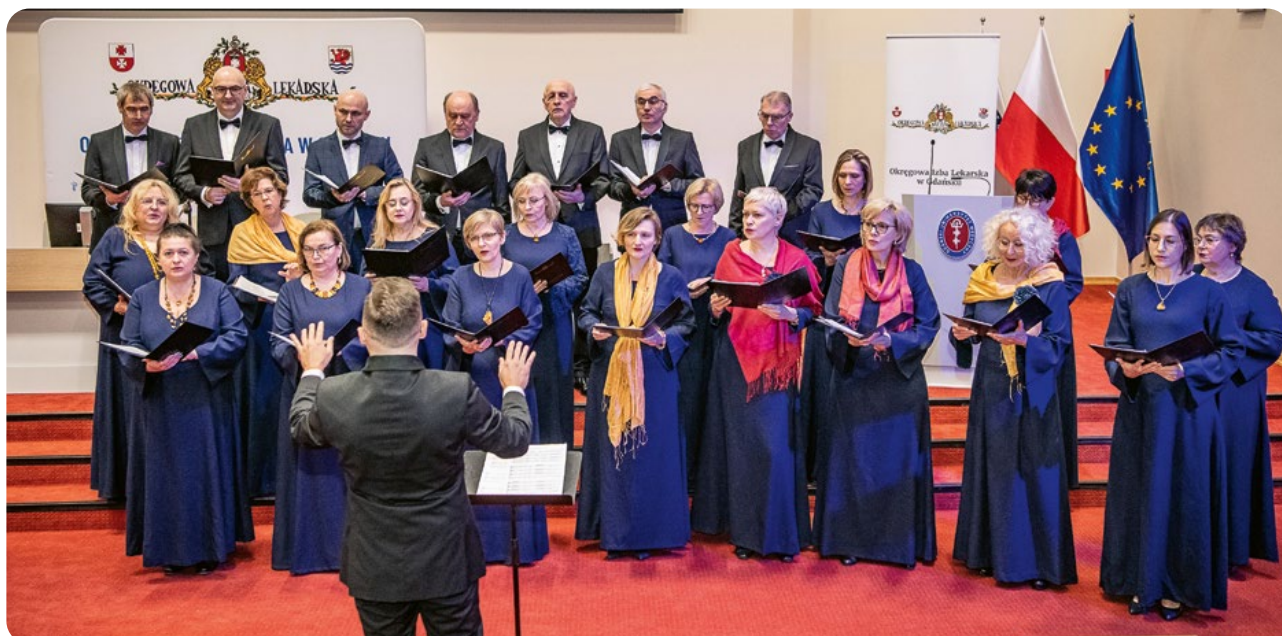
Występ chóru naszej OIL