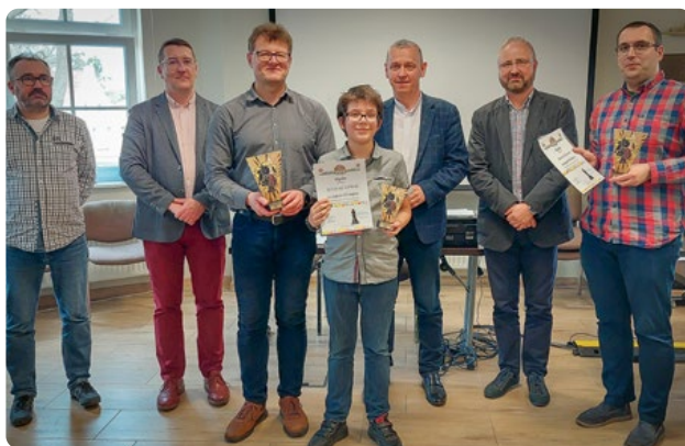
Najlepsi zawodnicy Turnieju