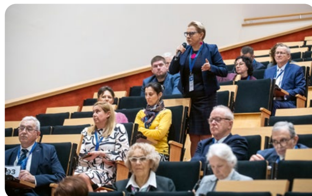
Ożywiona dyskusja na temat Ośrodka Szkoleniowego