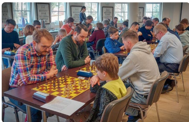
Zacięta walka niezależnie od wieku